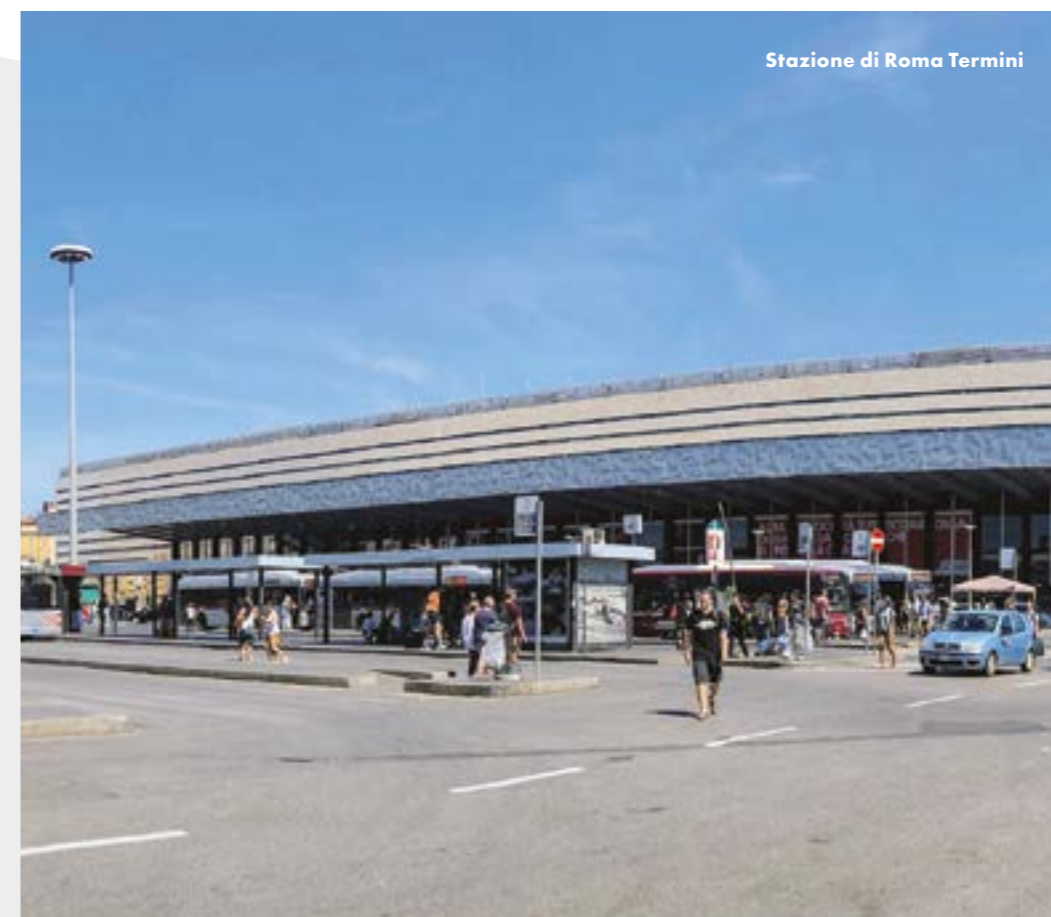
Stazione di Roma Termini

Grandi Stazioni Rail si occupa con passione e dedizione giornaliera della gestione delle 14 Grandi Stazioni Italiane.