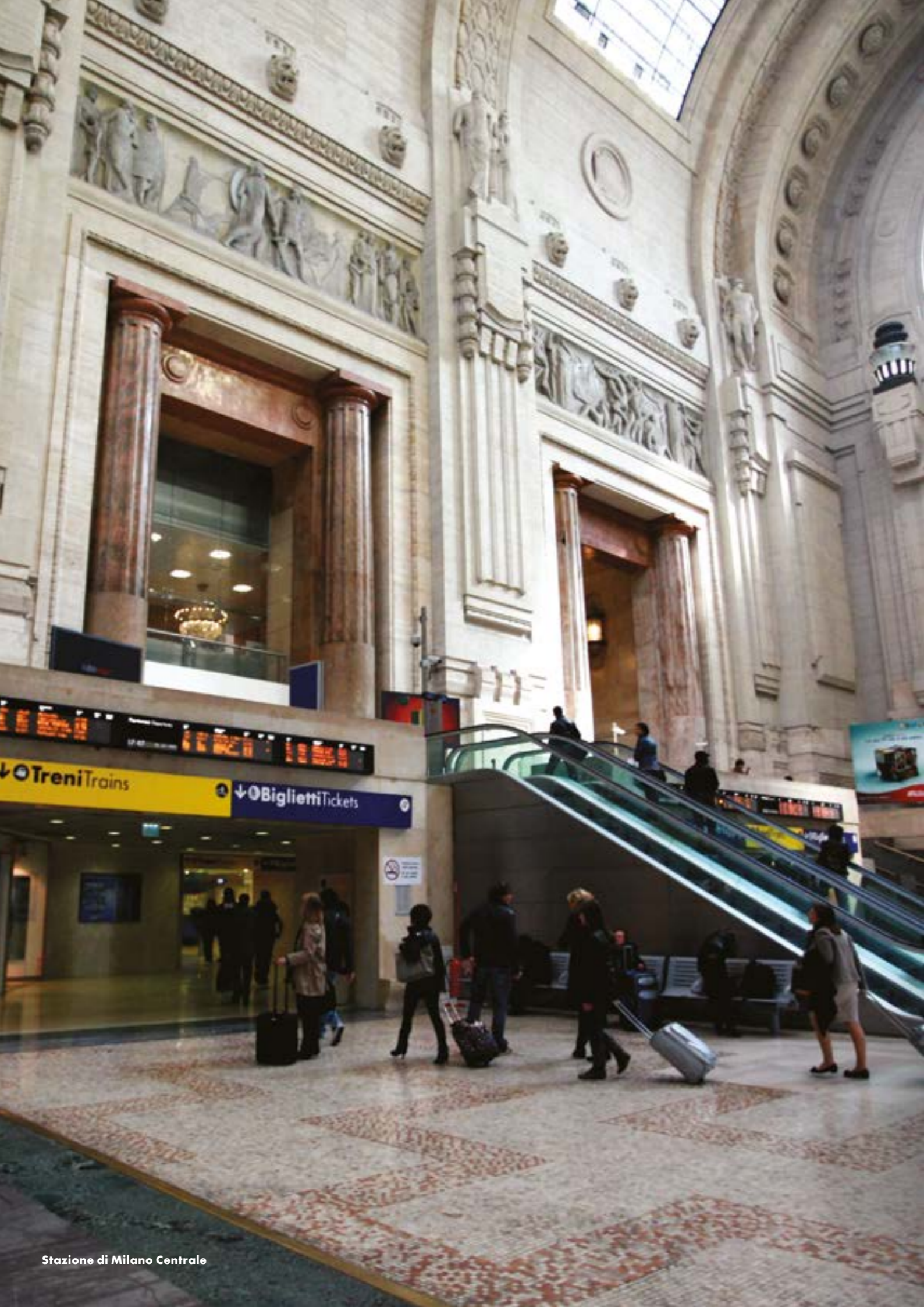
Stazione di Milano Centrale

Il livello di soddisfazione per la qualità dei servizi aggiuntivi è rilevato attraverso l'indicatore relativo ai servizi di carattere commerciale offerti nelle Grandi Stazioni da soggetti terzi. Sebbene non riconducibile interamente ad attività realizzate da Grandi Stazioni Rail, la presenza di adeguati servizi aggiuntivi contribuisce a rendere più confortevole la permanenza in stazione. Per questo Grandi Stazioni Rail monitora l'andamento dei servizi commerciali e nel 2022 punta a mantenere al massimo il valore obiettivo.