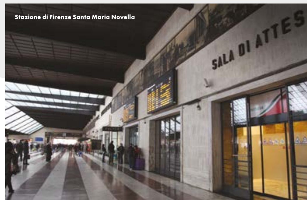
Stazione di Firenze Santa Maria Novella