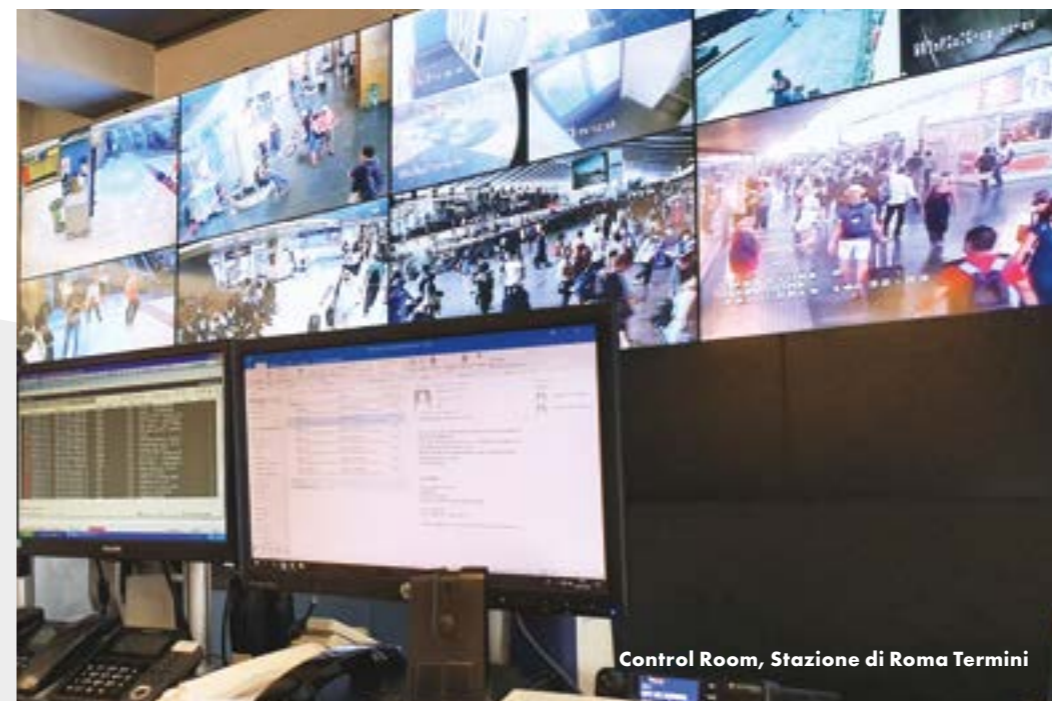
Control Room, Stazione di Roma Termini