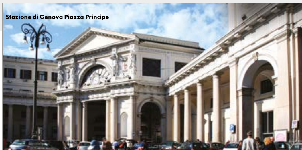
Stazione di Genova Piazza Principe

Le Grandi Stazioni, per la rilevanza e la specificità trasportistica che le caratterizzano, rappresentano già oggi l'epicentro di un nuovo modello di mobilità, pienamente funzionale allo sviluppo dei Piani urbani di mobilità sostenibile (PUMS) definiti dal DM 4 agosto 2017 quali strumenti di pianificazione trasportistica integrata con l'assetto e gli sviluppi urbanistici e territoriali. Tutto ciò viene confermato dai risultati emersi dal monitoraggio degli spostamenti di primo/ultimo miglio degli utenti del sistema ferroviario avviato nel 2018 tramite cui Rete Ferroviaria Italiana censisce, ogni mese, nelle principali stazioni del network nazionale - in parallelo con le indagini di customer satisfaction - la tipologia dei mezzi di trasporto con cui si arriva o si lascia la stazione, i relativi tempi di percorrenza e una serie di altre informazioni che consentono un'analisi statisticamente significativa degli spostamenti di afflusso e deflusso del sistema ferroviario.