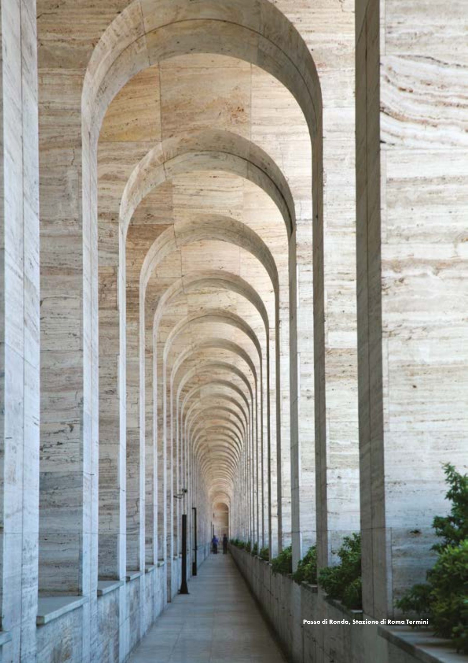
Passo di Ronda, Stazione di Roma Termini