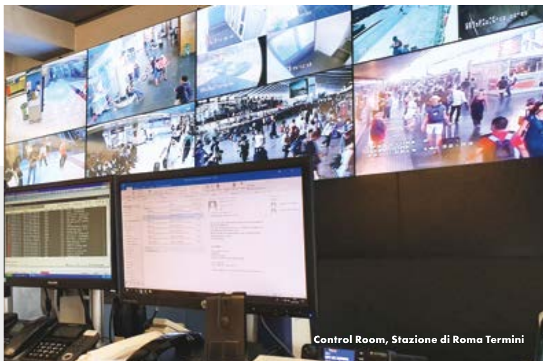
Control Room, Stazione di Roma Termini