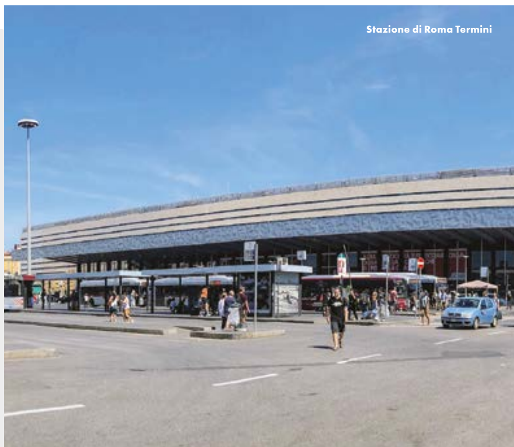
Stazione di Roma Termini

Grandi Stazioni Rail si occupa con passione e dedizione giornaliera della gestione delle 14 Grandi Stazioni Italiane.