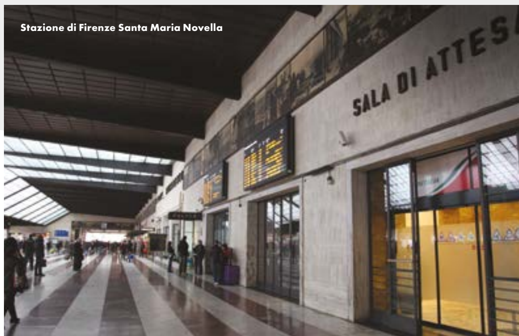
Stazione di Firenze Santa Maria Novella