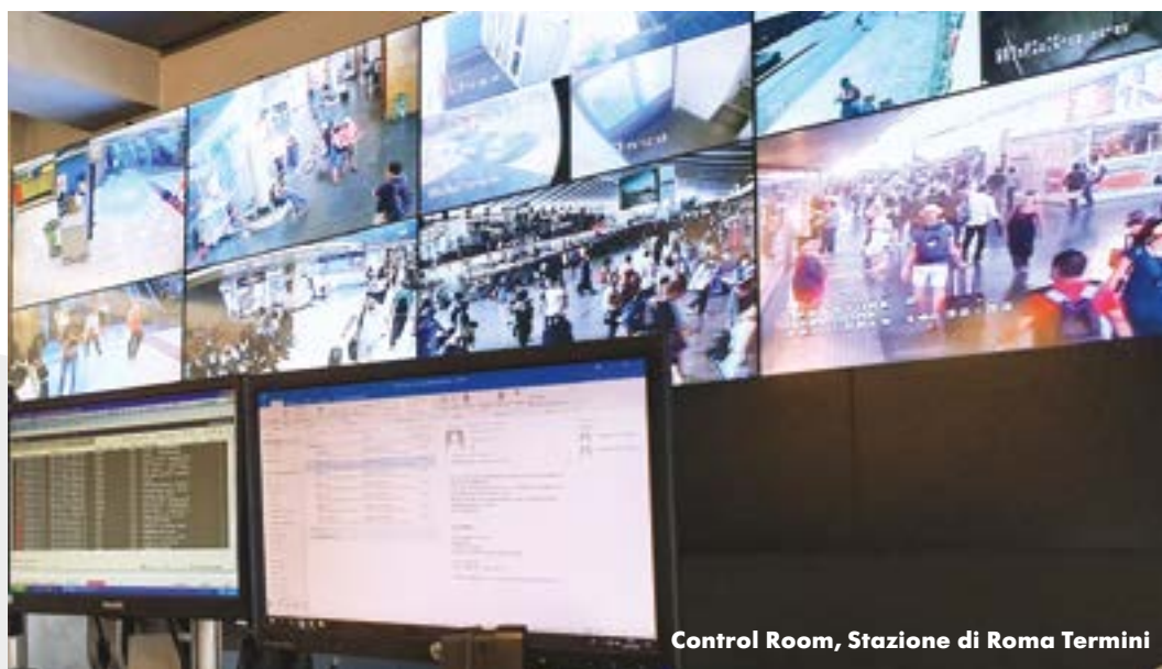
Control Room, Stazione di Roma Termini