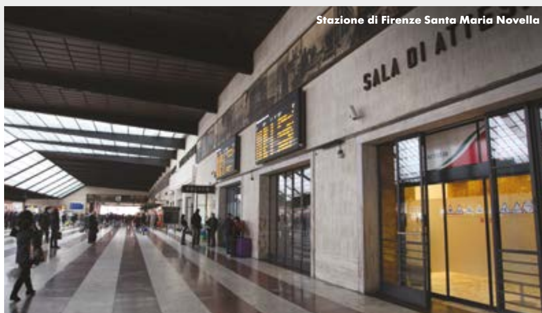
Stazione di Firenze Santa Maria Novella