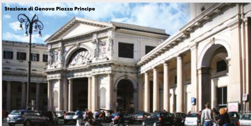
Stazione di Genova Piazza Principe

Le Grandi Stazioni, per la rilevanza e la specificità trasportistica che le caratterizzano, rappresentano già oggi l'epicentro di un nuovo modello di mobilità, pienamente funzionale allo sviluppo dei Piani urbani di mobilità sostenibile (PUMS) definiti dal DM 4 agosto 2017 quali strumenti di pianificazione trasportistica integrata con l'assetto e gli sviluppi urbanistici e territoriali. Tutto ciò viene confermato dai risultati emersi dal monitoraggio degli spostamenti di primo/ultimo miglio degli utenti del sistema ferroviario avviato nel 2018 tramite cui Rete Ferroviaria Italiana censisce, ogni mese, nelle principali stazioni del network nazionale - in parallelo con le indagini di customer satisfaction - la tipologia dei mezzi di trasporto con cui si arriva o si lascia la stazione, i relativi tempi di percorrenza e una serie di altre informazioni che consentono un'analisi statisticamente significativa degli spostamenti di afflusso e deflusso del sistema ferroviario.